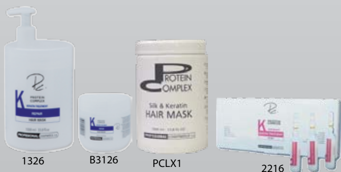
1326 B3126 PCLX1 2216

2201, 2211 - CLEANSING GŁĘBOKOCZYSZCZAJĄCY - kremowy szampon z zawartością witamin, oraz - kompleksu proteinowego, który obok gruntownego mycia rewitalizuje i odżywia włosy suche i porowate, nadając połysk i ułatwiając rozczesywanie. 1000ml - 2201, 250ml - 2211